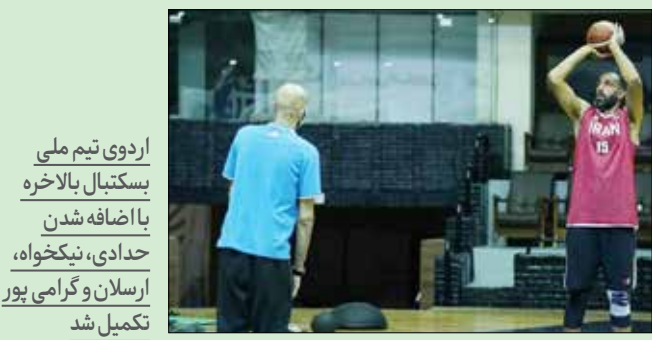
اردوی تیم ملی