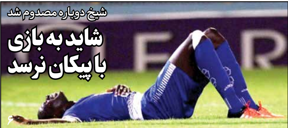
شیخ دوپاره مصدوم شد